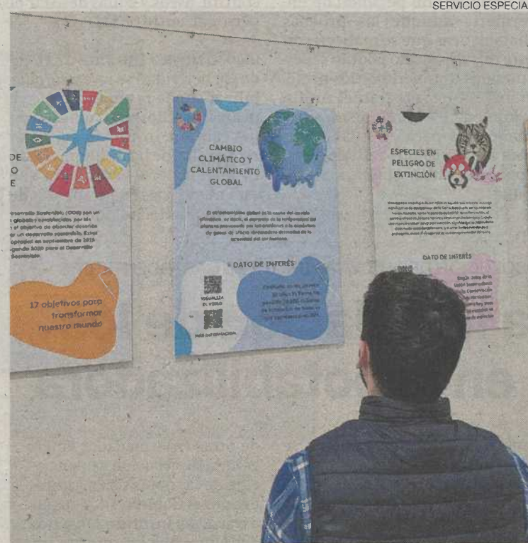
Exposición que acoge el Centro Fundación Ibercaja Actur.

Esta muestra está formada por interesantes carteles con códigos QR enlazados a videos informativos y recursos adicionales, profundizando en la com-