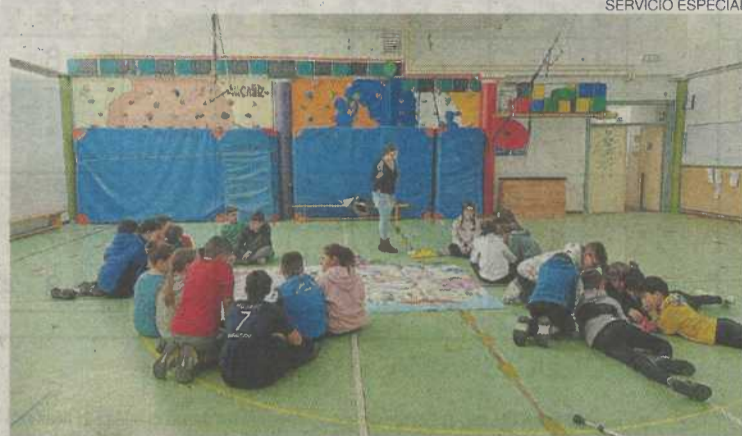
Dinamización del juego en el CEIP Juan Sobrarias de Alcañiz

Para ello se han creado dos juegos inclusivos: Ciudades accesibles , un juego de mesa muy divertido