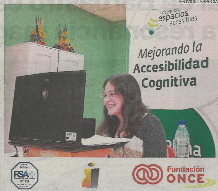
La formación para directivos se hizo en formato online.

nato son las personas que toman las decisiones importantes en una entidad.