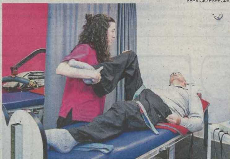
Un usuario se somete a una sesión de rehabilitación en Dfa.